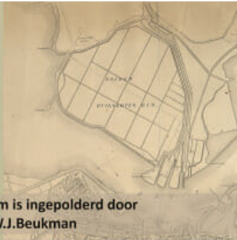
De Buiksloterham is ingepolderd door Ondernemer F.W.J.Beukman