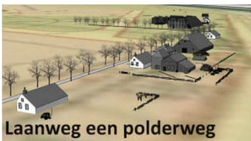
Laanweg een polderweg

In 1848 waren er overal in Europa opstanden en de Amsterdamse burgers en het stadsbestuur waren bang dat ook hier een revolutie zou uitbreken. Rijke burgers brachten snel geld bijeen om het werkloze gepeupel snel aan het werk te kunnen zetten. Die moesten de Buiksloterham afdammen om hem vervolgens leeg te kunnen malen. Maar toen het geld op was, het werk nog niet klaar en er geen opstand had plaatsgevonden, werd het werk gestaakt. Het stadsbestuur verkocht de grond van de Buiksloterham aan Franciscus Wessellus Josephus Beukman (1783-1867) die een stoomgemaal liet plaatsen en de polder in 1851 drooglegde. Hij verkocht de helft van de grond aan de Texelse grootgrondbezitter Keijzer die de grond net als hij verpachtte aan boeren. Het bleek een rijk landbouwgebied dat goede oogsten gaf en waar op voor de tijd grote kavels modern gewerkt kon worden. Er werden peulvruchten en granen verbouwd.