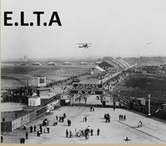
Eerste Luchtverkeer Tentoonstelling Amsterdam