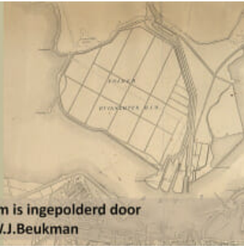
De Buiksloterham is ingepolderd door Ondernemer F.W.J.Beukman